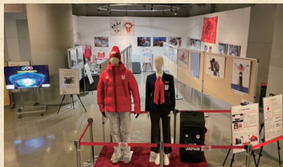
▲(参考) 北京 2022 大会報道写真展当時の様子