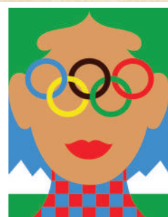
ミラノ・コルティナ 2026 大会 公式ポスター (所蔵：札幌オリンピックミュージアム)