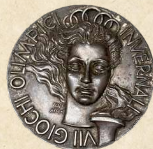
コルティナ 1956 大会 アルペンスキー・回転 2 位 猪谷千春選手 銀メダル (所蔵：秩父宮記念スポーツ博物館)